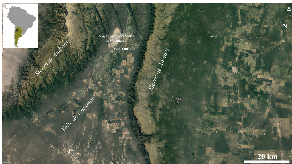
Figura 1. Mapa de ubicación del sitio La Viñita.

La muestra cerámica analizada procede de las investigaciones realizadas en el sitio La Viñita, localizado en el sureste de la ciudad de San Fernando del Valle de Catamarca (Figura 1). La misma fue recuperada en sendos trabajos de campo realizados durante los años 1983 y 2008 (Nazar 2012). Aspectos morfológicos, tecnológicos y decorativos fueron estudiados en una muestra de aproximadamente 900 fragmentos cerámicos y varias piezas remontadas según lo establecido en Nazar y De La Fuente (2016). Además, se analizaron petrográficamente a nivel cualitativo un total de 25 secciones delgadas.