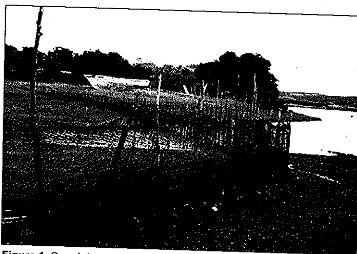
Figura 1. Corral de pesca actual de piedras, varas y redes.

Existen más corrales de varas y piedras y, se podría decir que los que están en uso coincidentemente se sitúan en islas del mar interior y no en la Isla Grande de Chiloé. Entre las posibles razones para este fenómeno está el aislamiento no sólo geográfico sino tecnológico que diferencia a la Isla Grande de las menores, siendo los corrales un método vinculado a prácticas antiguas que ya no es utilizado en zonas donde la influencia del continente es cotidiana (Figura 1).