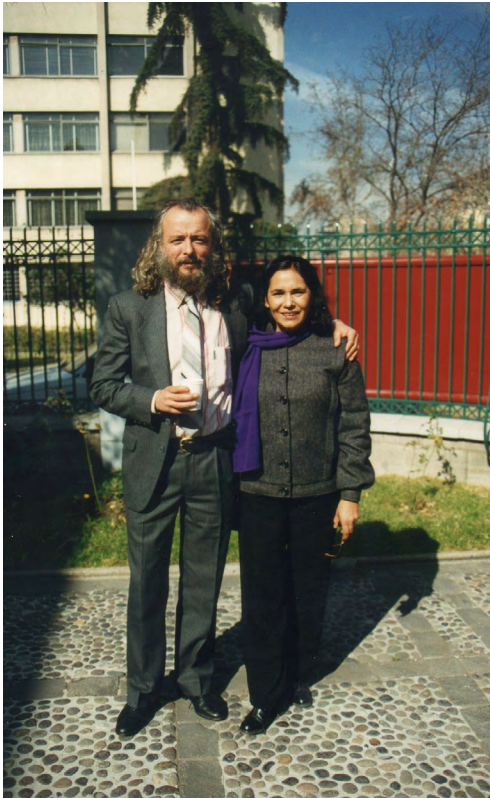
Figura 1. Taller Hombre Temprano y Paleoambiente en Tierra del Fuego , realizado en el Museo Benjamín Vicuña Mackenna, en 1998.